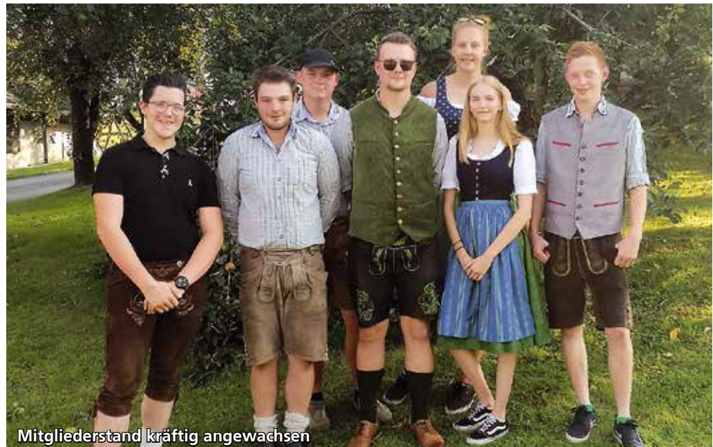
Mitgliederstand kräftig angewachsen