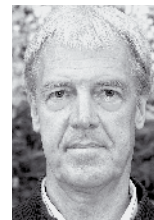
von Gerhard Langmann

Ab 2012 war die Betreuungsgruppe für die Tagesbetreuung für Senioren/innen im „Haus der Generationen“ zu-