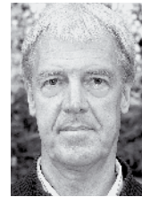
von Gerhard Langmann

als einzigartig in der Steiermark. Aus der Tatsache, dass die meisten davon aus der näheren Umgebung kommen, liest er die Verbundenheit des Vereins in der Bevölkerung ab. Der Wermutstropfen heuer? Wegen der Corona-Beschränkungen werden die Zuschauer Überflüge mit manntragenden Flugzeugen, Kunstflugvorführungen, Fuchsjagd, Zuckerbomben (für Kinder) und spektakuläre Modellflugvorführungen nicht zu sehen bekommen. Die Jubiläumsflugshow wird, so der Obmann, im nächsten Jahr nachgeholt. Das Schöne am Modellflugsport: Er bietet Betätigung für alle Altersgruppen vom Kind bis zum Senior. Geflogen werden Modelle wie Hubschrauber, Segelflugzeuge und Motorflugzeuge, die sowohl von klassischen