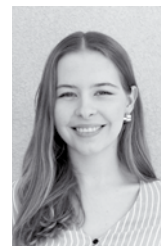
von Katrin Löschnig

rationen ein Treffpunkt für Freunde und Familie. Mit heranwachsenden Kindern sehe ich, wie wichtig es ist, dass es für die Jugend und Schulkinder dieses Angebot gibt.“, erzählt Familie Pörtlberger. „Wir verbringen sehr viel Zeit im Stainzer Freibad – weil wir dort schwimmen und springen, beachen, spielen, essen und unsere Freunde treffen können. Nicht nur wir genießen den gesamten Sommer dort, sondern auch viele Familien, zahlreiche Jugendliche und Senioren. „Rajmund“ der Bademeister, der alles am Laufen hält, ist uns auch schon sehr ans Herz gewachsen. Das Freibad macht Stainz zu einer sehr lebenswerten Gemeinde.“ spricht Familie Hazmuka. Doch nicht nur die Stainzer Familien genießen das Freibad: „Wir kommen gern in das Stainzer Bad wegen der familiären Atmosphäre, den großen Bäumen, den verschiedenen