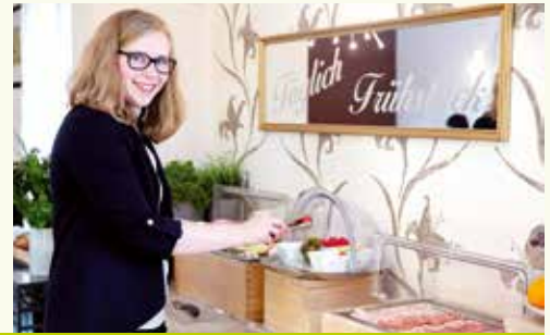
Gestartet haben wir bei der Bäckerei Freydl mit einem ausgezeichneten Sekfrühstück.