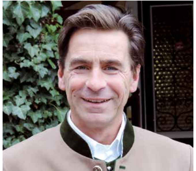
Franz Graf Meran

Er sprach schon damals von einer Zerstörung von Lebensräumen und Ökosystemen durch den Menschen, welchen dringend Einhalt zu gebieten wäre, um auch kommenden Generationen eine intakte Umwelt gewährleisten zu können. Da er auf der anderen Seite auch ein großer Mann der Förderung des technischen Fortschrittes war, war es ihm wohl auch bewusst und erfüllte ihn daher mit großer Sorge, dass die Menschheit eben diesen zu einseitig und ausschließlich für sich selbst zunutze machen würde, ohne dabei an die zweifellos auch