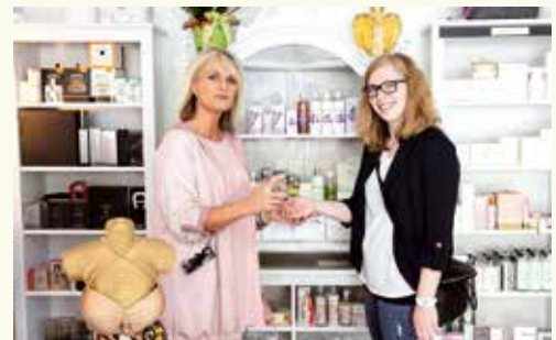
... weiter geht's: schlendern über den Hauptplatz, reingeschaut bei der Gärtnerei Hammer und schmökern bei Urig trifft Edel ...