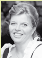
von Claudia Dunst- Mösenlechner