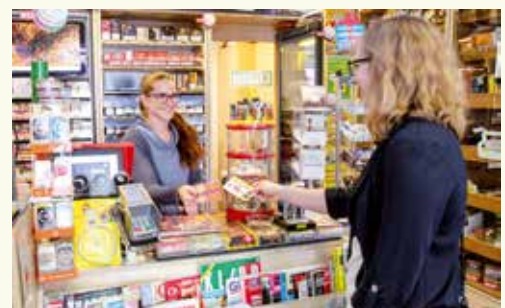
... für den Freund wandert eine Stange Salami vom Messner in die Einkaufstasche und für die Mama „Glückslose“ der Trafik Schauer ...