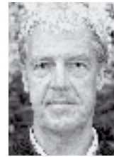
von Gerhard Langmann

Stets hatten Werner Gaich & Co. Verbesserungen der Veranstaltungen im Auge. „Den Teilnehmern soll mehr als bloß ein Rennen geboten werden“, formten sie um die Laufver-