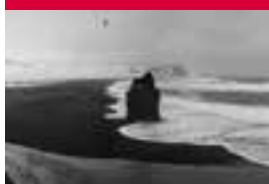
Foto-Film-Live Reportage „Island – Die Natur spüren“