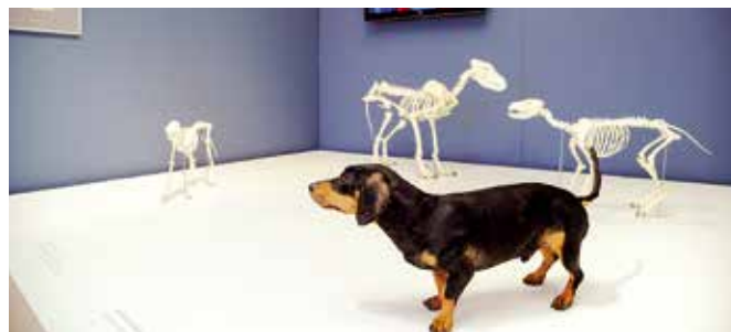
Wieviel Wolf steckt im Hund?

Eine faszinierende Ausstellung im Jagdmuseum Stainz