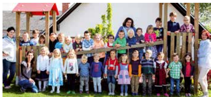
Mit positiver Einstellung ins Leben

Im Kindergarten Pichling gelten 5 Grundsätze