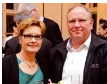
Die „Bretterkliers“ bei der WKO-Ehrung.