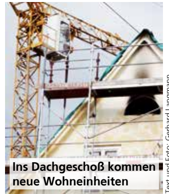
Ins Dachgeschoß kommen neue Wohneinheiten

Das Problem bei den aktuell laufenden Arbeiten: Das Abtragen der zerstörten Substanz