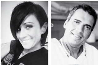
von Manuela Buchebner und Hubert Reif