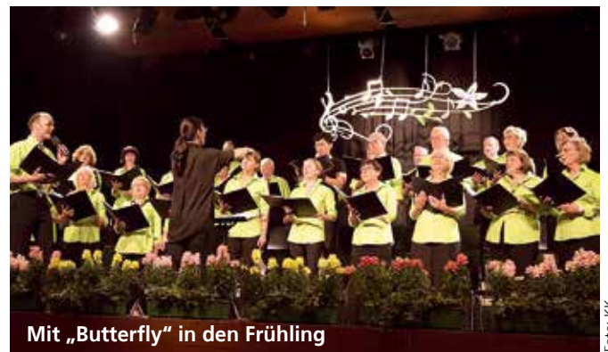
Mit „Butterfly“ in den Frühling

denn er wird für Maiandachten ebenso gerne eingeladen wie zu Hochzeiten, Firmungen und dem Erntedankfest. Den Höhepunkt im Winter stellen die Adventkonzerte in Lannach und Graz St. Vinzenz dar.