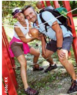
Tu es einfach!

Die Besucher erwartet ein reichhaltiges und abwechslungsreiches Programm