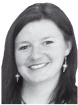
von Regina Rihtar