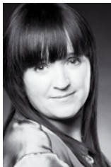
von Barbara Zapfl