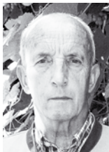
von Werner Waniek