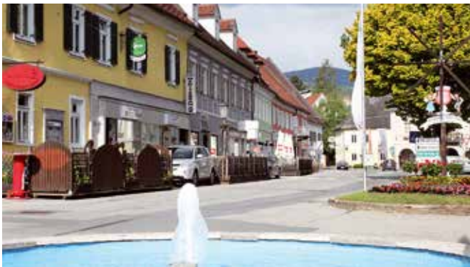
Ansicht bald Geschichte

M ehrere Bürgermeister haben sich schon im Umbau des Stainzer Hauptplatzes versucht. Verkehrszählungen, Anrainerbefragungen und kommunale Vorschläge: alles schon dagewesen und nach Sichtung in den Schubladen verschwunden.