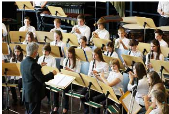
Eine hervorragende Leistung beim Landeswettbewerb 2013